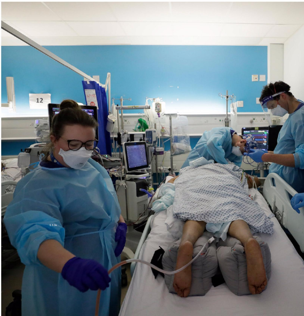
Een coronapatiënt wordt eind januari behandeld in een van de Londense ziekenhuizen, waar een maand eerder een nijpende situatie was ontstaan.

Een nieuwe ziektegolf met tot wel 170 duizend besmettingen per dag zou ons nu ongeveer moeten hebben bereikt, een gevolg van de Britse variant. In werkelijkheid ging het aantal besmettingen niet omhoog, maar omlaag. Waarom schotelden ambtenaren het kabinet in januari een veel te hoge prognose voor?