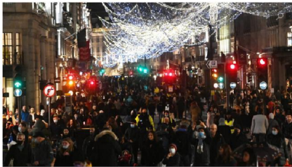
Winkelpubliek in Regent Street in het centrum van Londen op 12 december

In Engeland komt er een einde aan de tweede nationale lockdown. Dat heeft premier Boris Johnson aangekondigd