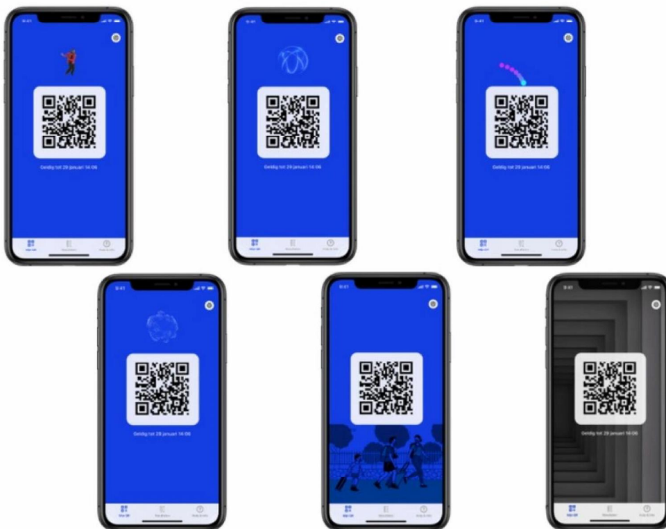
Verschillende opties animaties

Voor de meeste deelnemers roept geen enkel van de bovenstaande opties het gevoel op dat het bijdraagt aan de veiligheid van het concept.