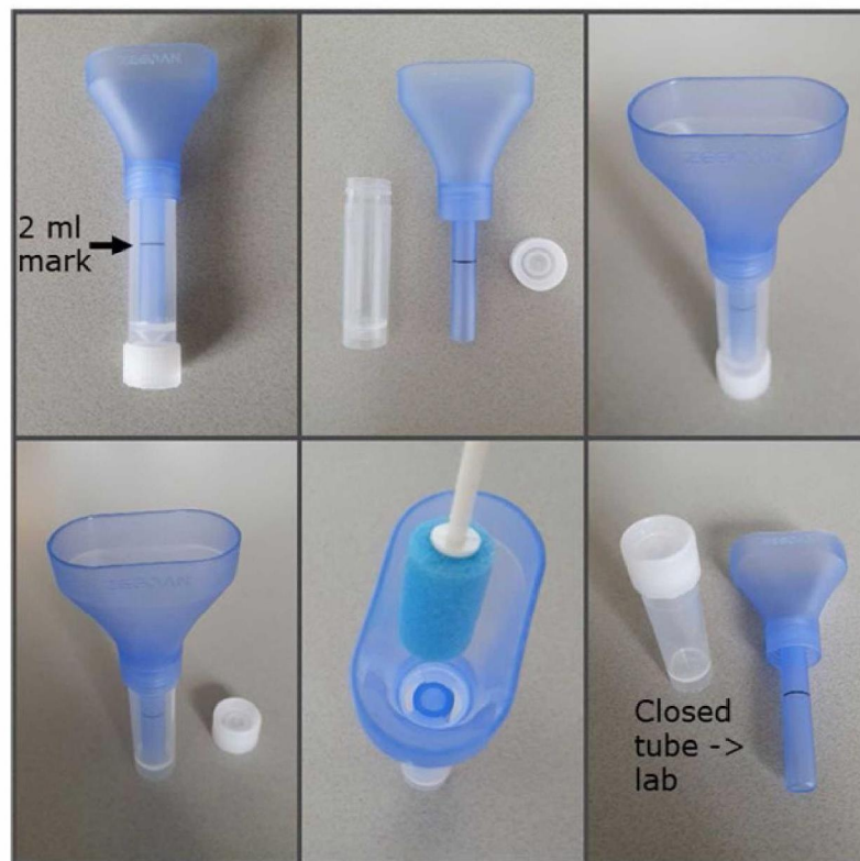
Figuur. Verzamelbuisje met trechter en Oracol-spons op stok (midden onder) voor het afnemen van een speekselmonster.

Om tegemoet te komen aan de wens tot eenvoudig en veilig afnemen en verwerken in het laboratorium, is gekozen voor het combineren van een Oracol S10 sponsje op stok (Malmed UK) en een Zeesan trechter met verzamelbuis (Zeesan, Xiamen, China, custom order) (zie figuur). Met de spons is het speeksel eenvoudig en veilig af te nemen en met het buisje en trechter is het speeksel eenvoudig en veilig te verwerken in het laboratorium.