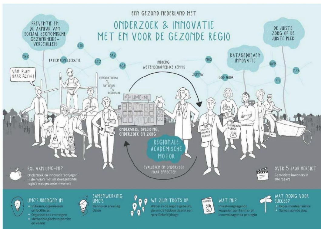
Figuur: Recente 'praatplaat' waarin de ambities en werkwijze van de umc's wordt samengevat

Door de umc's wordt in het kader van dit plan momenteel regionale kennis- en innovatie-agenda's opgesteld. Het maandelijks landelijke 'kwartiermakersoverleg' van de regio-vertegenwoordigers binnen het NFU-traject heeft het karakter van een 'lerend netwerk, waarbij best practices worden uitgewisseld en gezamenlijk taken worden opgepakt. Onderstaand beeld geeft de ambities en werkwijze hiervan globaal weer.