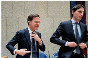
Minister Wopke Hoekstra van Financien en MP Rutte

In contacten met kleine en grote bedrijven is er een enorme behoefte om uit de crisis te investeren. En dan geen geld meer stoppen in de economie van de 20 e eeuw maar in die van de 21 e eeuw. In lijn met de Green deal."