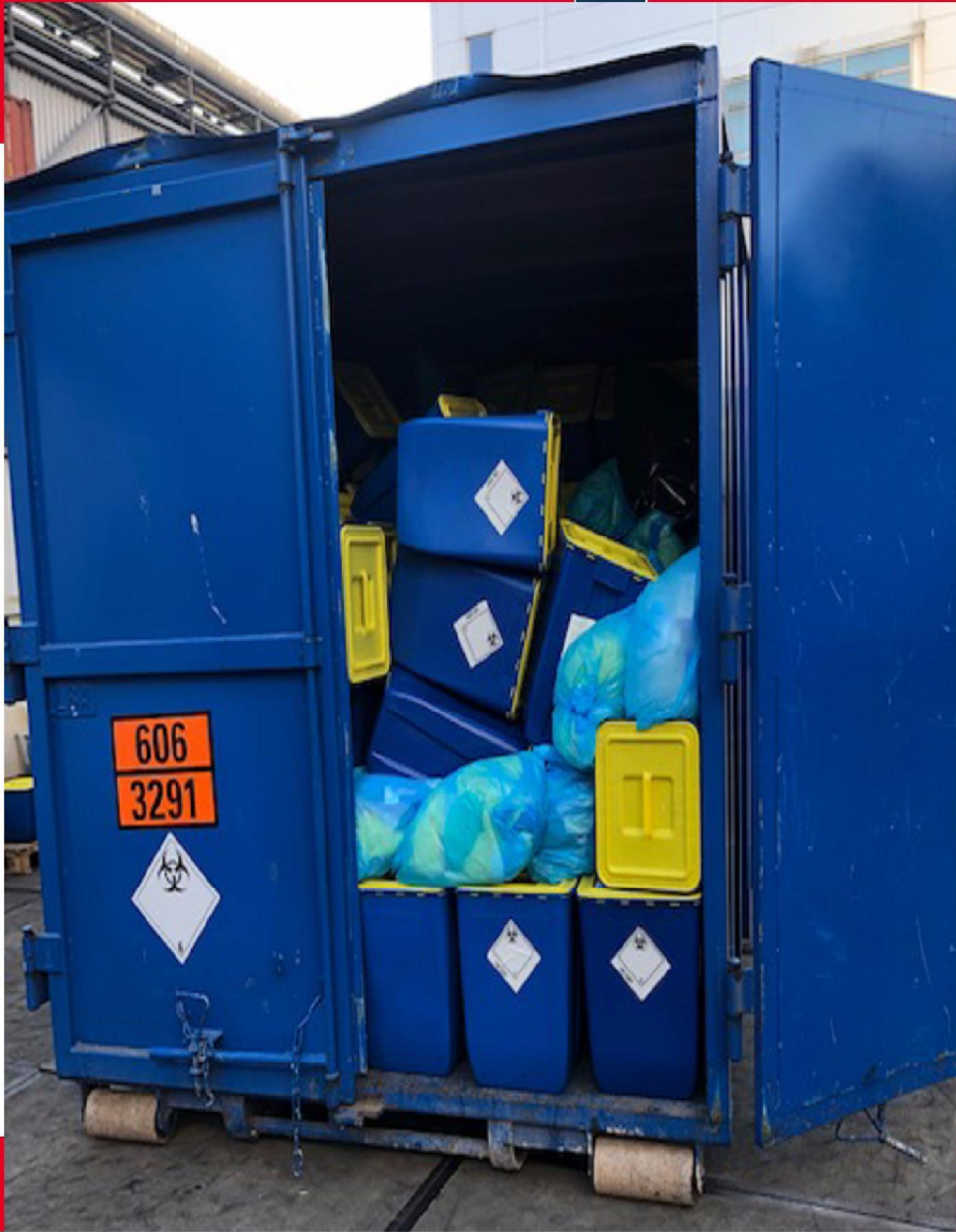
ing en Transport