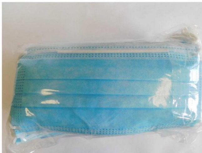
Abb. 1: Zogear Surgical Mask Type IIR