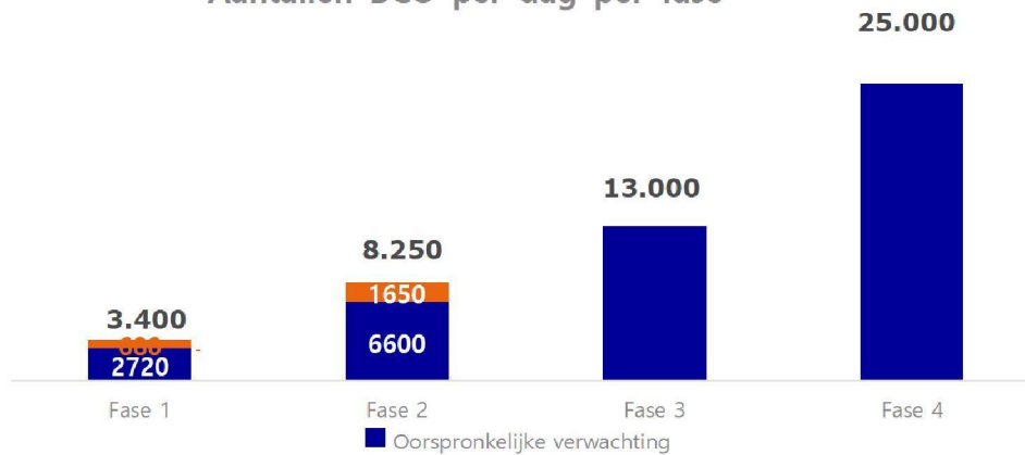
Aantallen BCO per dag per fase

Door beoogde efficiency winsten en ervaringseffecten, verwachten we half december ~25% hogere productiviteit te realiseren in de eerste 2 fasen van BCO