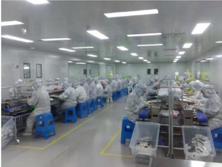
Productie LYHER-zelftesten in China