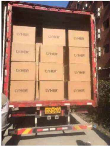
Vervoer in China naar vliegveld