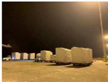
ULD's klaar voor vertrek op vliegveld China