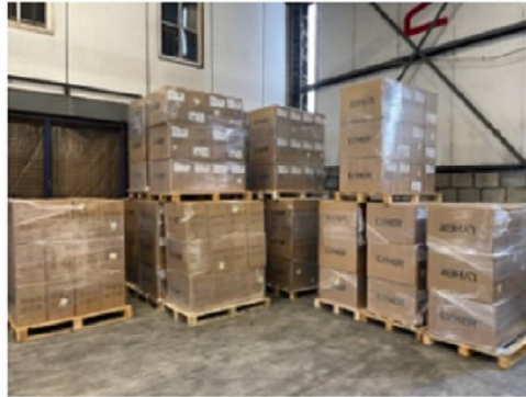
Pallets klaar voor vervoer naar VWS