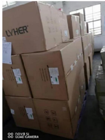
Goederen klaar voor transport in magazijn producent LYHER in China