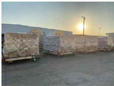
ULD's stapelen vliegveld China