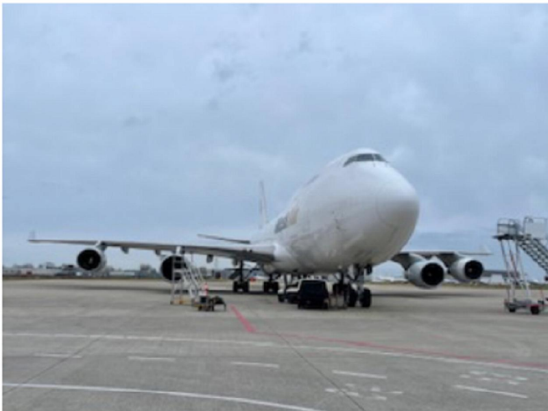
In- en uitladen vliegtuigen