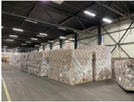
Goederen in eerste linie loods Nederland